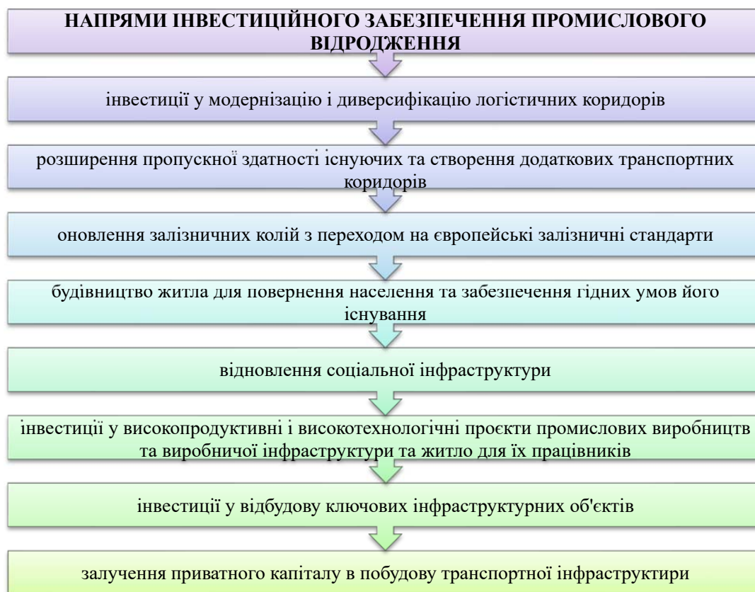
Рисунок 1 – Перспективні вектори інвестиційного забезпечення промислового відродження економіки