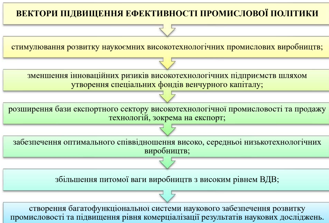
Рисунок 3 – Вектори підвищення ефективності промислової політики