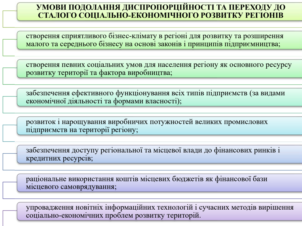
Рисунок 2 – Умови зниження диспропорційності та реалізації перспектив соціально-економічного розвитку регіонів України