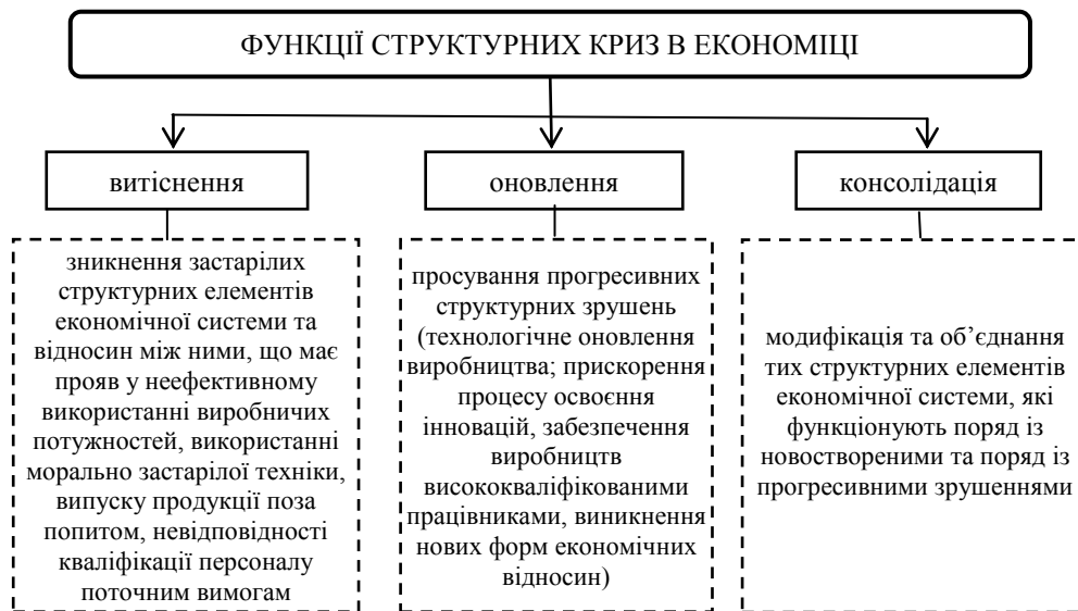
Рис. 1. Функції структурних криз (складено на основі [24, 6, 3])

структурну перебудову економіки в цілому для забезпечення прогресивного економічного зростання країни. Усе це обумовлює перехід капіталу з найбільш традиційних виробництв до новостворених. У загальному підсумку структурні кризи виконують ряд важливих функцій, які можна навести на рис. 1.