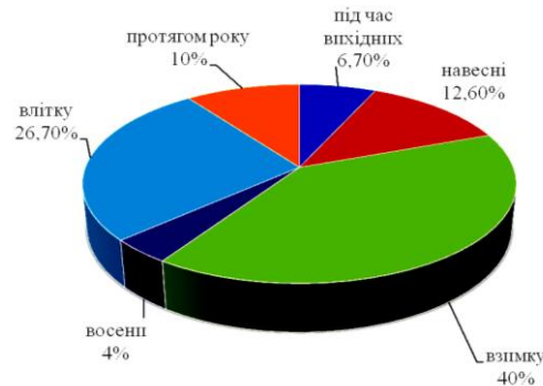
Рис. 2. Показники туристичного попиту господарств сільського зеленого туризму

організація може досить точно визначити структуру повної собівартості туристського продукту; застосування цього методу основними конкурентами створює умови для зниження цінової конкуренції. Недоліком витратного методу є те, що використання стандартної націнки не дозволяє в кожному конкретному випадку враховувати особливості купівельного попиту та конкуренцію, а отже, визначити оптимальну ціну). Агрегатний метод застосовується під час виробництва товарів або надання послуг, що складаються з окремих елементів, які входять до туристичного пакета: транспортне обслуговування, готельні послуги, організація дозвілля, екскурсійні послуги та ін. Статистичний метод базується на аналізі динамічного ряду цін аналогічних послуг. Метод поточних цін встановлює ціну дещо вищу або нижчу рівня цін конкурентів. Метод відчутної цінності послуги припускає включення в ціну особливих гарантій покупцям. Параметричний метод означає, що ціна знаходиться у безпосередній залежності від головного параметра послуги сільського зеленого туризму або визначається сукупністю найважливіших параметрів. Метод експертних оцінок дозволяє складати прогнози щодо цін на туристському ринку.