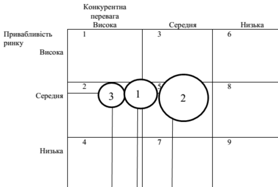
Рис. 2. Матриця GE/McKinsey

Цю позицію займають підприємства із такими видами бізнесу, в яких ринкова привабливість тримається на середньому рівні, але при цьому переваги підприємства на ринку очевидні й сильні. Такому підприємству необхідно насамперед визначити найпривабливіші ринкові сегменти та інвестувати саме в них, покращувати можливості, протистояти дії конкурентів, збільшувати обсяги виробництва і таким чином добиватися збільшення прибутковості свого підприємства. Підприємство повинне реінвестувати прибуток та одержати максимальну вигоду.