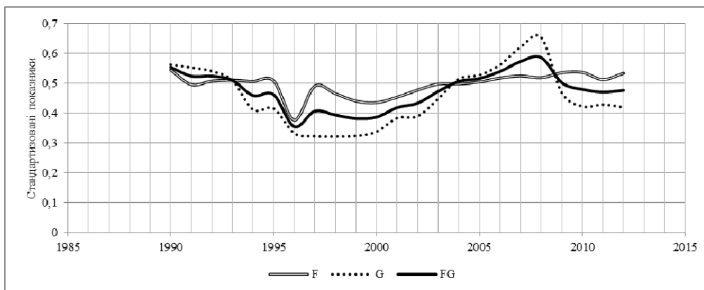
Рис. 2. Зміни стандартизованої узагальноної характеристики соціально-економічного розвитку FG у поєднанні із соціальною F та економічною G складовими Складено і розраховано автором за даними [21]

Виходячи з перебування траєкторії узагальноної характеристики соціально-економічного розвитку FG у зоні фрагментарного втручання в процеси її зміни, можна стверджувати, що це питання так і не стало пріоритетним у політиці трансформаційних перетворень. Це категоричне твердження впливає з фактів циклічних змін стандартизованих показників соціального та економічного розвитку зі змінним домінуванням одного над іншим. Відомо, що існують дві методологічні конструкції щодо співвідношення соціального й економічного у суспільній динаміці. Згідно з логікою здійснюваної соціальної конверсії економічні відносини мають підпорядковуватися соціальним. Проте цю сентенцію необхідно сприймати дещо умовно, оскільки мова йде не про прогресування соціального поступу над економічним. Тим більше, що згідно з рис. 2 при взятті економічного розвитку під контроль державних інституцій більш прийняттого характеру набуває соціально-економічна динаміка загалом.