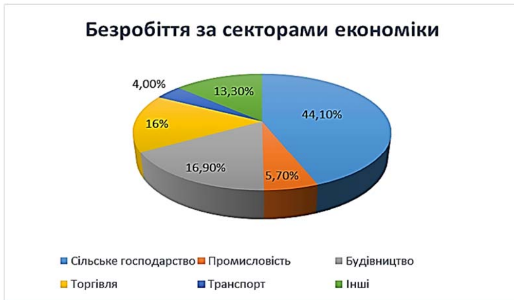
Рисунок 3 – Безробіття в Україні за секторами економіки