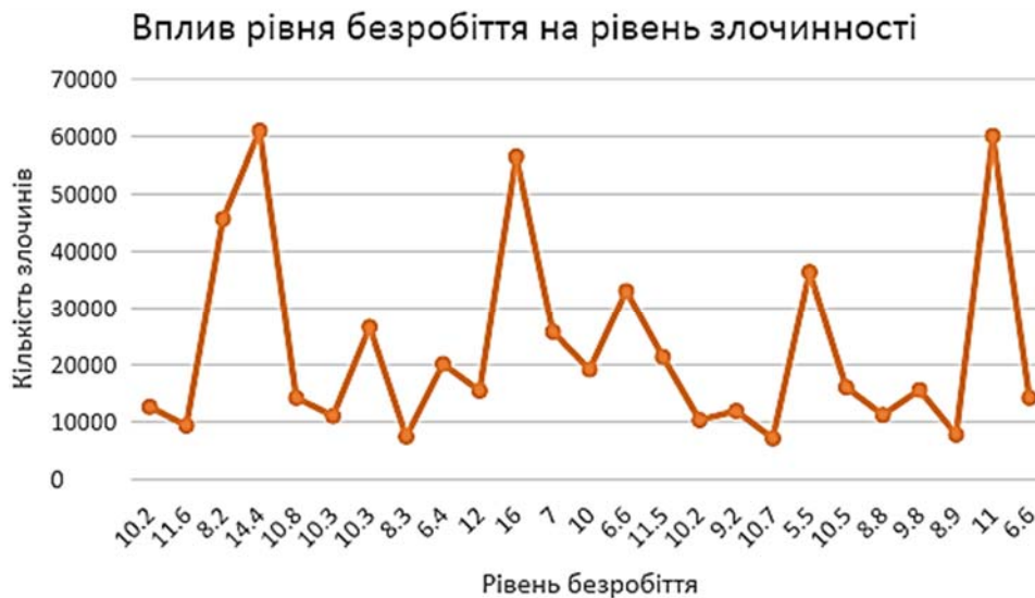
Рисунок 5 – Вплив рівня безробіття на рівень злочинності у регіонах України у 2020 році

чої сили, реформувати трудове законодавство, сприяти розвитку суб'єктів бізнесу, зокрема малого бізнесу, за потреби сприяти професійній перепідготовці кадрів та виділенню бюджетних місць у ВНЗ по напрямках підготовки, яких не вистачає на ринку праці.