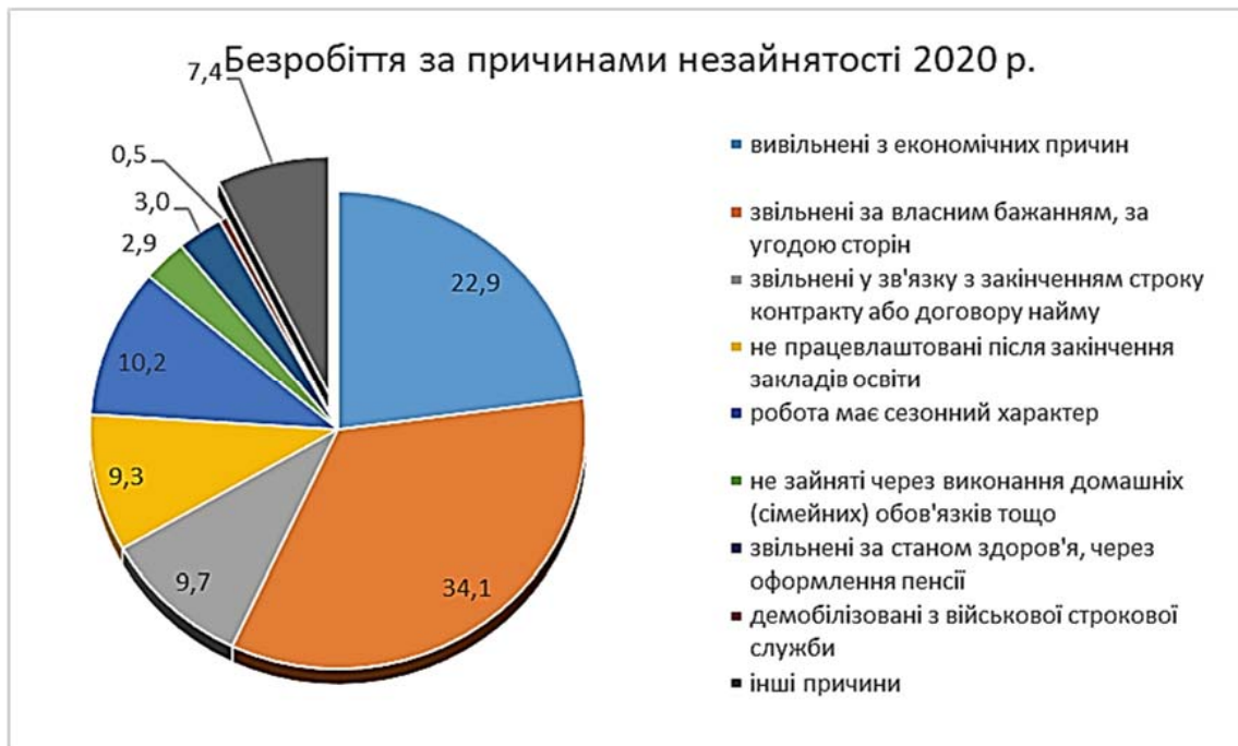
Рисунок 4 – Безробіття в Україні за причинами незайнятості у 2020 році, %

Варто зауважити, що безробіття має й позитивні сторони, такі як посилення конкуренції між працівниками, яке призведе до підвищення якості виконання службових обов'язків, зростання соціальної значущості праці, а також стимулювання підвищення інтенсивності і продуктивності праці.