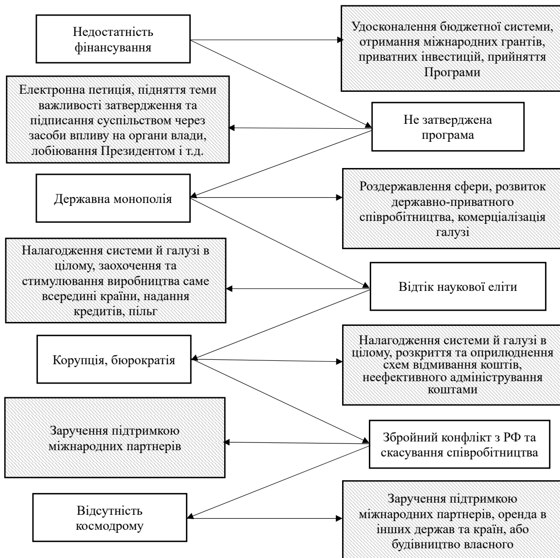
Рисунок 3 – Причинно-наслідкові зв'язки між виявленими проблемами в авіаційно-космічній галузі та способами їх усунення

Пропозиція № 2 – розробка Кабінетом Міністрів України, а також підконтрольного йому центрального виконавчого органу – ДКАУ способу нормативного врегулювання приватного сектору у галузі – з метою боротьби проти державної монополії у галузі.